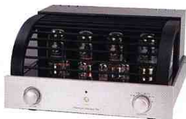
PrimaLuna ha logrado en este equipo una relación calidad/precio realmente sorprendente.

De ahí, la elección del ampli integrado DiaLogue Two como mejor ampli del año. Equipado con las célebres válvulas